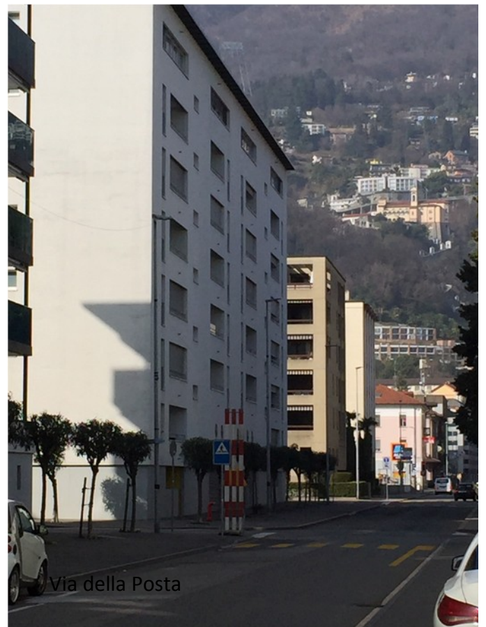
Via della Posta