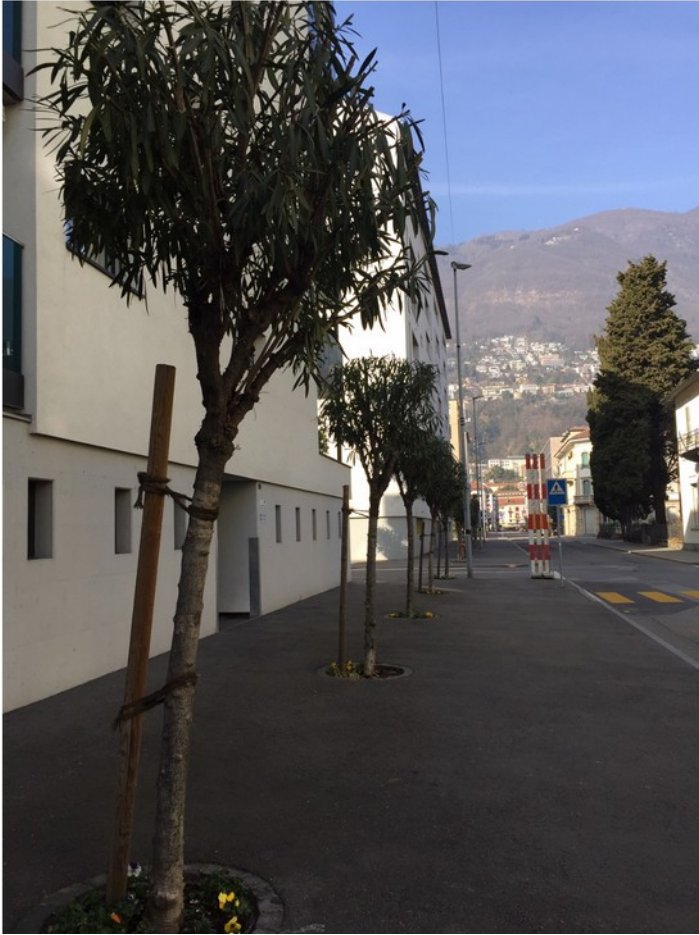
Via della Posta