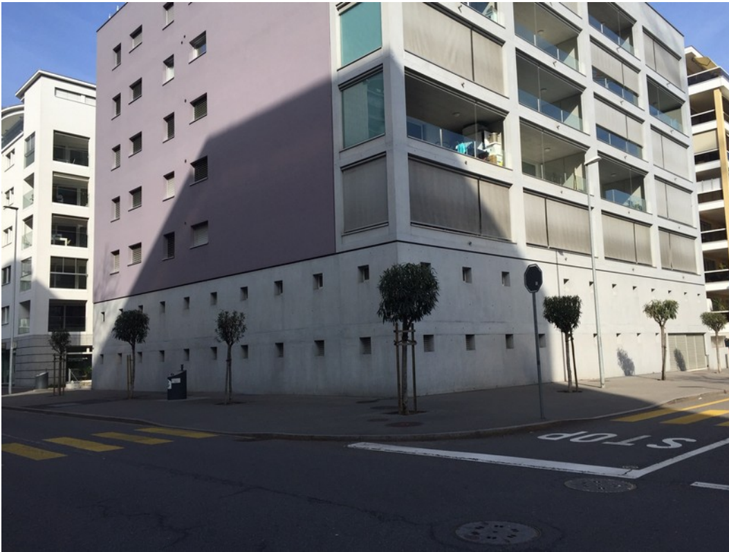
Via S. Balestra