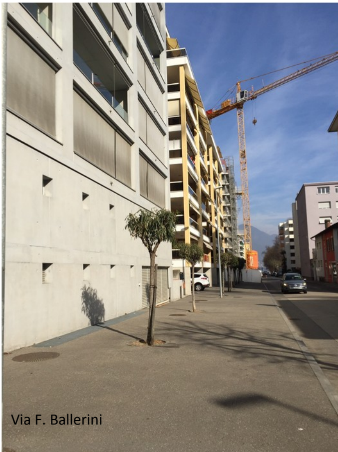
Via F. Ballerini