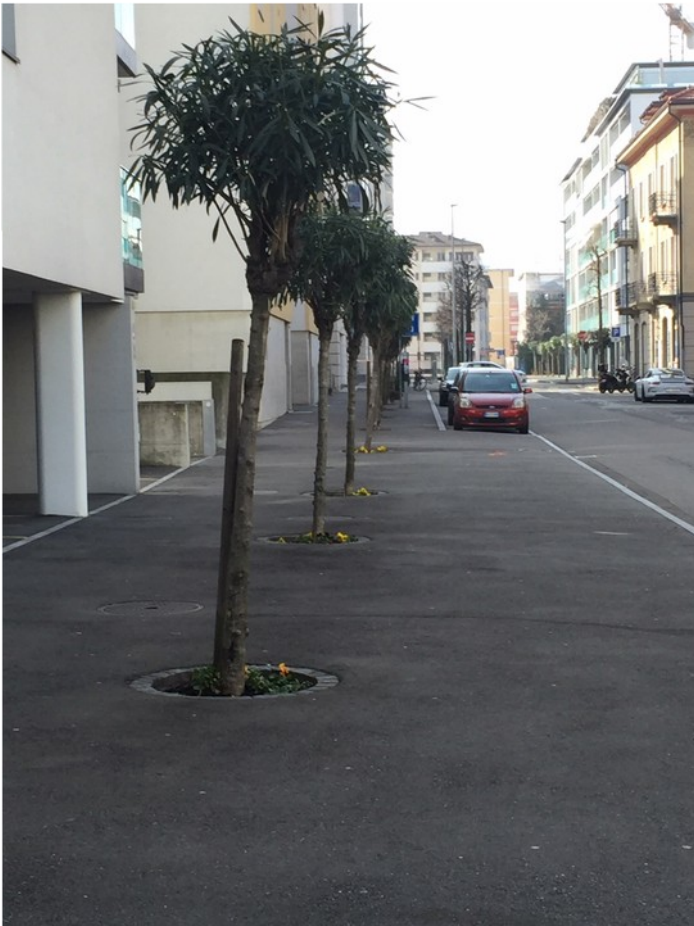
Via S. Franscini